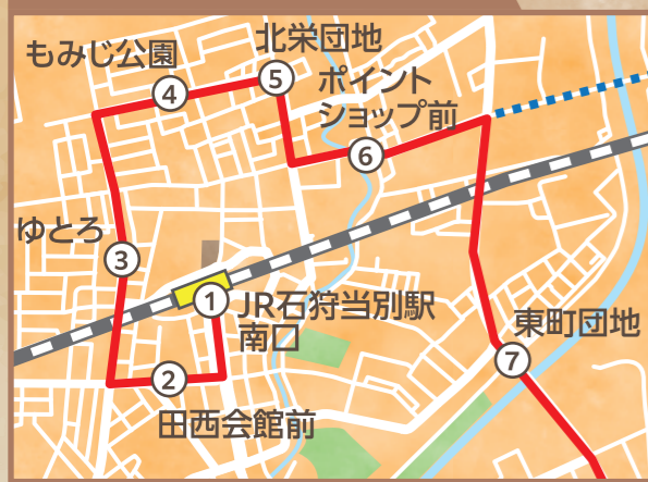
JR石狩当別駅周辺 拡大図