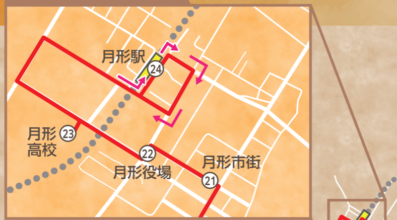
月形駅周辺 拡大図